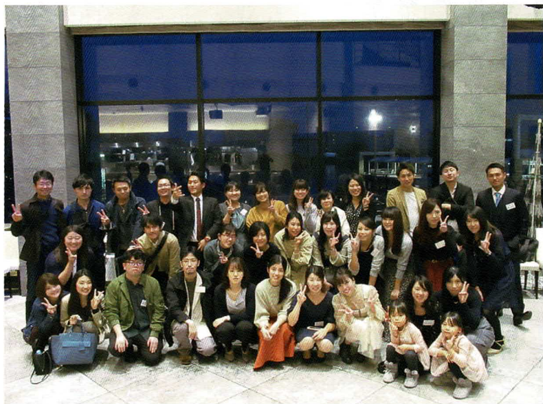
平成21年度卒業生 学年同窓会