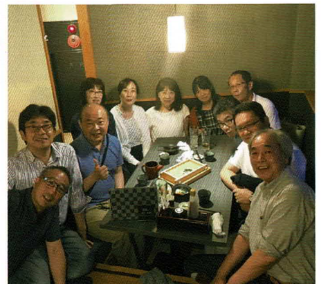
昭和54年卒業3年A組クラス会