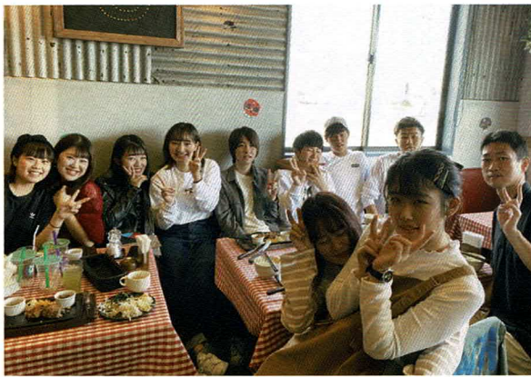
2019年3月卒3年H組同窓会

2019年3月に卒業したH組、初の同窓会を行いました。久々に高校の友達に会えて凄